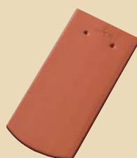
Biber blago zaobljeni