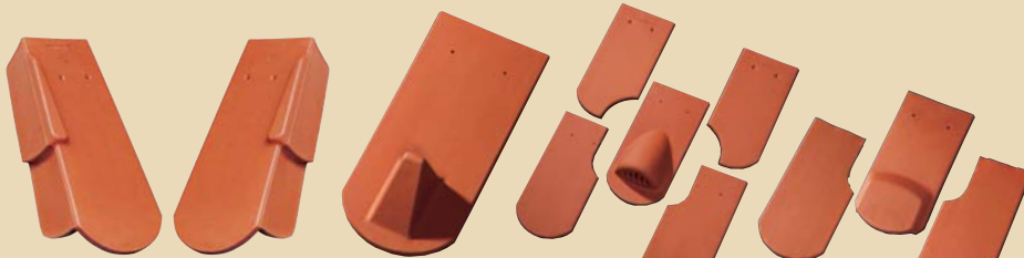
Završni crijep lijevi