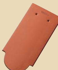
Biber Model Schuppen