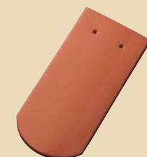
Biber Model Steyr