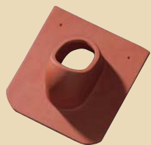
Crijep za napu ili antenu