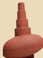
Glineni priključak za antenu